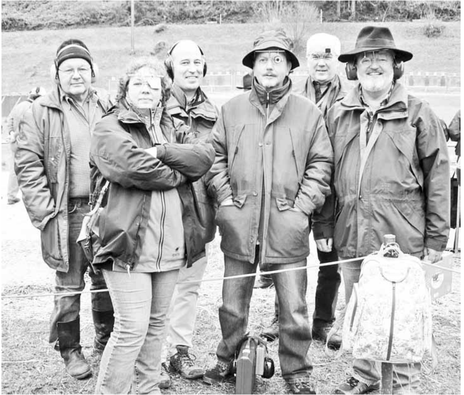
Impressionen vom Morgartenschiessen