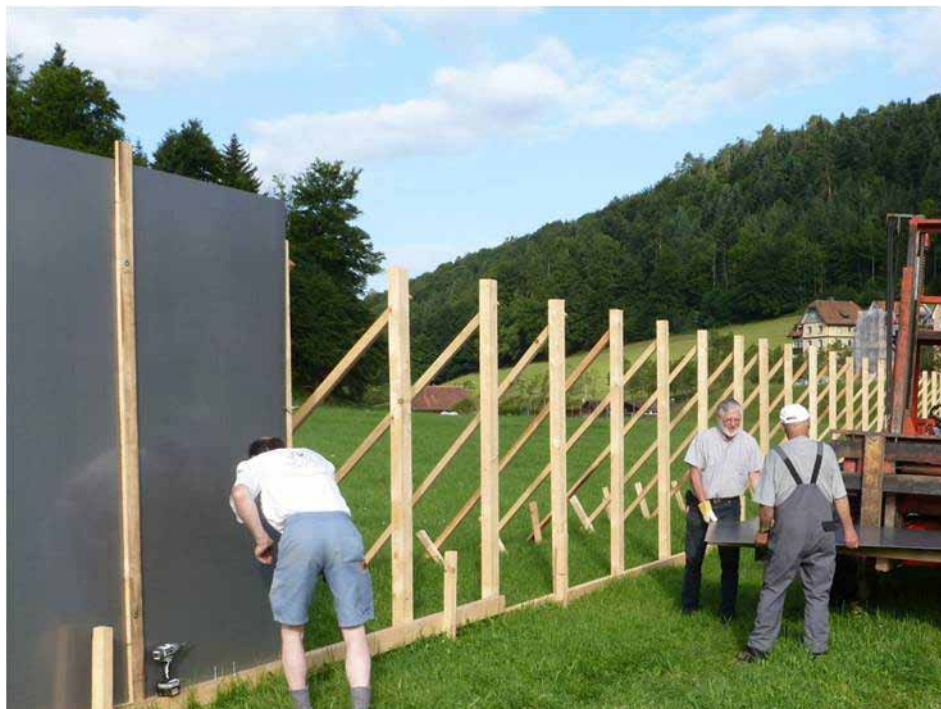
Sportschützenfest 2012 Impressionen vom Aufbau