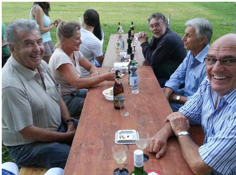
1. August auf der Weierweid